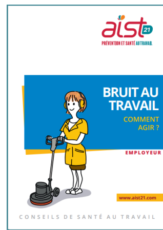
Plaque Employeur Bruit au travail

Retrouvez toutes les ressources documentaires à votre disposition sur notre site internet . Commander des exemplaires papier : ici