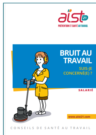
Plaque Salarié Bruit au travail