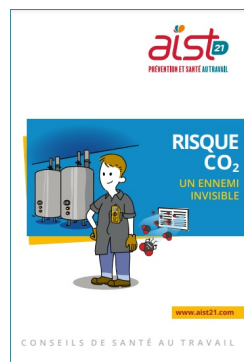
Plaquette Risque CO2, un ennemi invisible

Retrouvez toutes les ressources documentaires à votre disposition sur notre site internet . Commander des exemplaires papier : ici