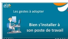
Vidéo Bien s'installer pour travailler sur un écran