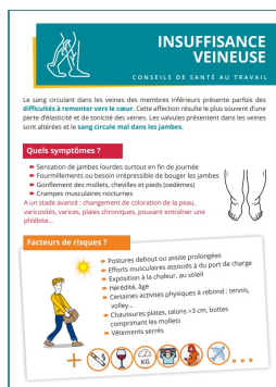
Flyer Salarié Insuffisance veineuse