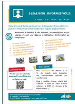
Flyer Modules de e-learning à disposition de vos salariés