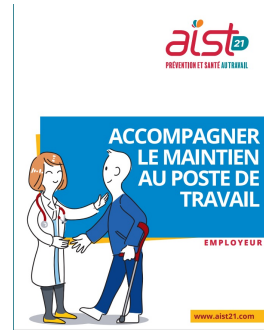
Plaquette Employeur Accompagner le maintien au poste de travail

Retrouvez toutes les ressources documentaires à votre disposition sur notre site internet . Commander des exemplaires papier : ici