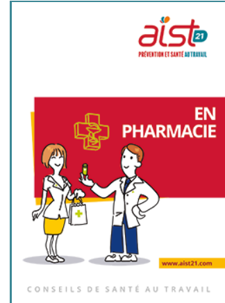
Plaquette employeur En pharmacie

Retrouvez toutes les ressources documentaires à votre disposition sur notre site internet . Commander des exemplaires papier : ici