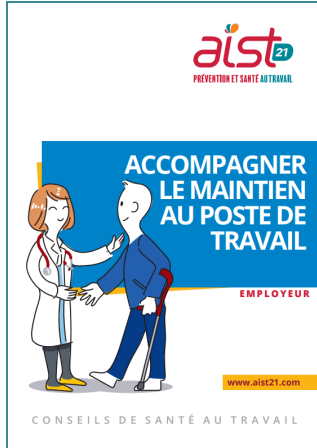
Plaquette employeur Accompagner le maintien au poste de travail