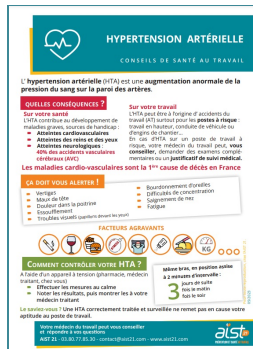
Flyer Hypertension artérielle